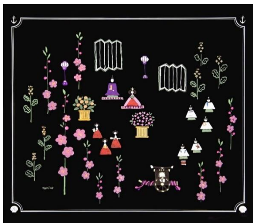
「おひなさま」浅倉田美子作