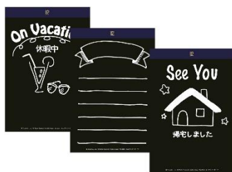
オフィスのデスクの伝言板に