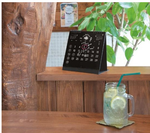
卓上タイプは小スペースで大活躍