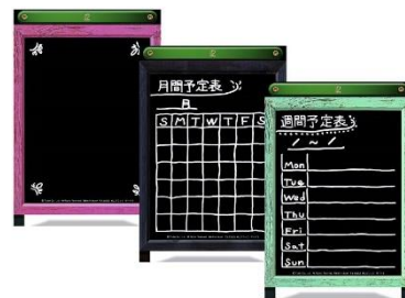
便利な週間、月間予定表もあり

株式会社トーダンは今後も“くらしを豊かに、こころを豊かに”を企業理念に、生活シーンを楽しく、明るくするような、また社会・文化に貢献できるカレンダーづくりをしてまいります。