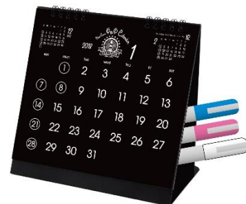
サイドに付属ペン入れあり