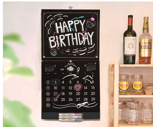
右:壁掛けを広げて、イラストを描いたイメージ