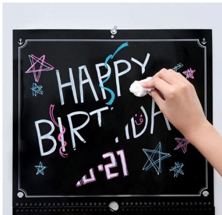
ティッシュできれいに消せる

今までカレンダーは「見る」「読む」「書く」が基本機能でしたが、今回のカレンダーは「楽しむ」要素が加わりました。お子さんにはお絵かきの延長線上で楽しんで書いていただき、大人にはクリスマスやお正月といった行事ごとや、季節ごとにイラストを変えて楽しむこともできるので、様々なコミュニケーションボードとしても使えます。