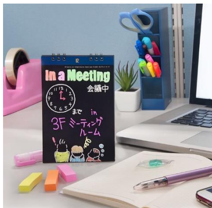
「卓上ブラック・ボード(メッセージ付タイプ)」

コンパクトサイズで、手軽に持ち運びができるので、特別な日を記憶させたり、友人とのパーティーのウェルカムボードにしたり、メニューの紹介をしたり、イラストを描くことで、カラフルなアート作品に仕上げることもできます。使い方次第で、楽しさが広がり、ボードマーカーがあれば、いつでもどこでも自由に書いて消せるので、インスタ映えする商品として、SNS等で家族や友人とコミュニケーションができる、ライフスタイルツールとして楽しめる商品です。