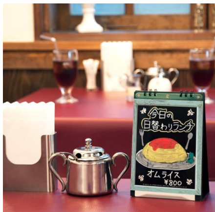
「卓上ブラック・ボード(フリータイプ)」