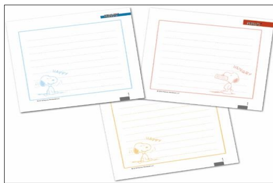
■裏面は全8パターンのイラスト入りのメモ欄に！