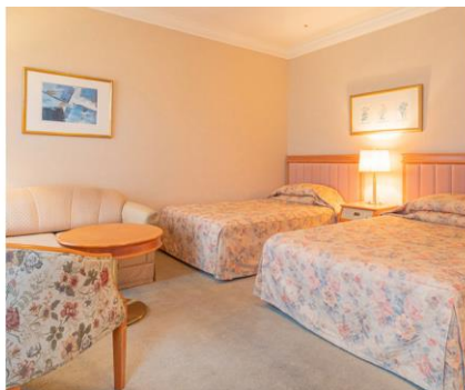
犀北館ホテル客室

今回新商品の認知拡大のため、“初夢枕札”(枕の下に敷いてよい初夢を祈願する縁起物)が、130年以上の歴史を持つ長野市のクラシックホテル「犀北館ホテル」と、東京 水道橋の「庭のホテル 東京」で、宿泊客へのプレゼントキャンペーンに採用されることになりました。(キャンペーン詳細別紙参照)これは、新型コロナウイルス流行の中、2022年こそ良い年になるようお願いを込め、日本古来の縁起物“初夢枕札”を復刻し、少しでも多くの方々に体験頂きたいという当社の思いに賛同いただき実現したものです。