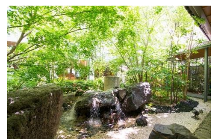
庭のホテル 東京 庭園