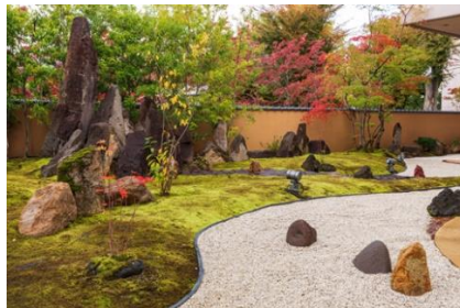
犀北館ホテル 庭園