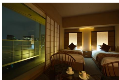
庭のホテル 東京 客室