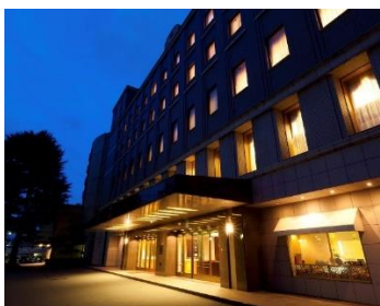
犀北館ホテル 外観