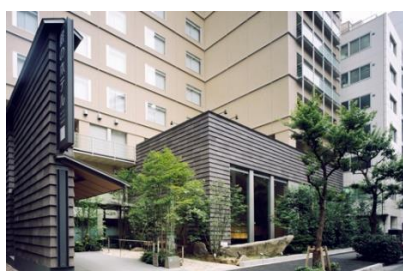
庭のホテル 東京 外観