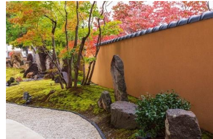
犀北館ホテル 庭園